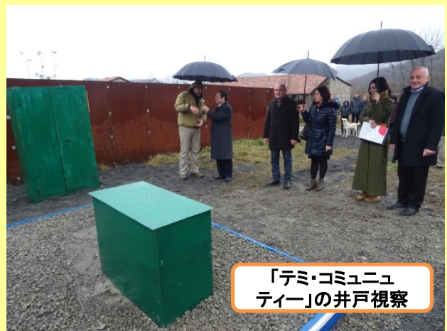
「テミ・コミュニティー」の井戸視察