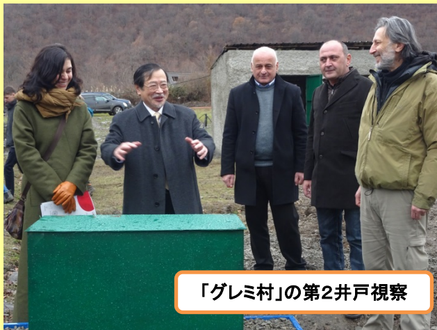
「グレミ村」の第2井戸視察