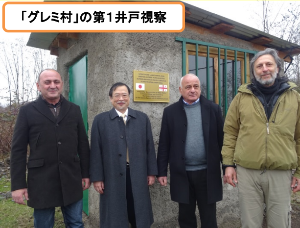
「グレミ村」の第1井戸視察

クヴァレリ地区グレミ村では、夏季は干ばつ、冬季は凍結により、水の供給がほとんどなく、他に利用できる水源がないため深刻な水不足が問題となっていました。そこで、同村の安定的な水の供給を図るため、我が国の支援により同村2箇所及び同村にある「テミ・コミュニティー」(障がい者・元路上生活者のための社会福祉施設)1箇所の計3箇所に井戸を建設しました。本計画により、同村の住民合計1200人が整備された井戸を通じて良質な飲料水を常時利用できるようになり、保健衛生環境が大幅に改善されました。今回の整備計画への支援額は、71,729米ドルです。